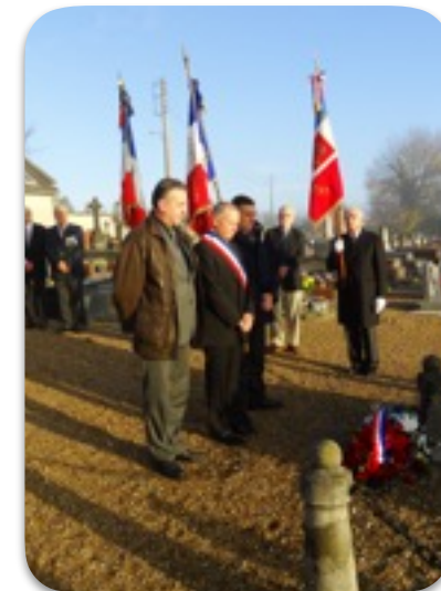
Dépot de gerbe et recueillement