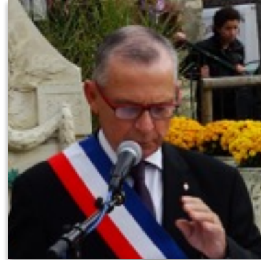
Hugues RIBAUT Maire d'Andrésy