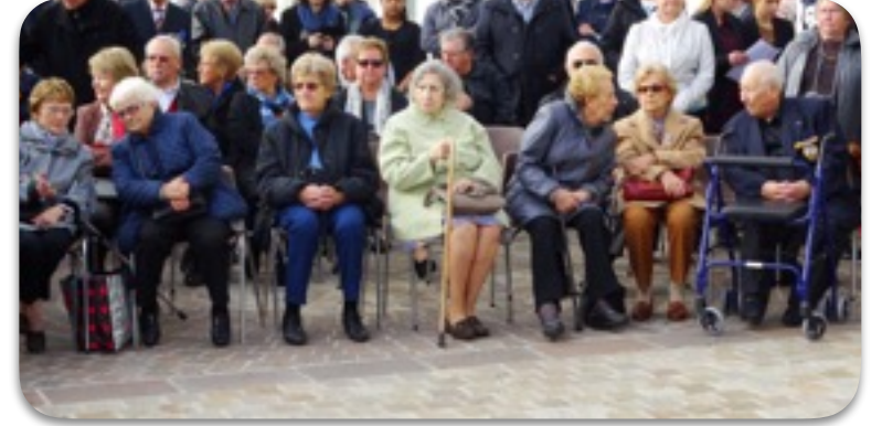
Place du 8 mai 1945 Les Andrésiens sont venus nombreux pour commémorer le 97 e anniversaire de la Grande Guerre