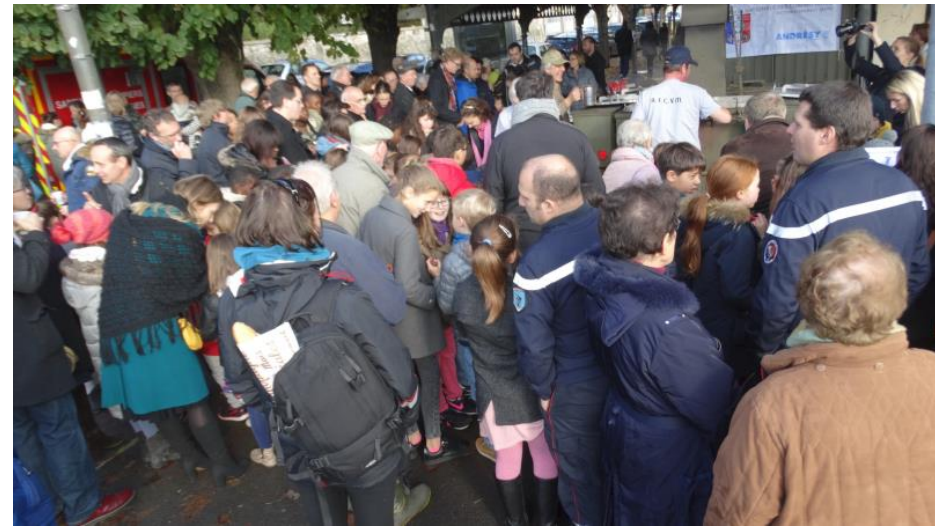
La commémoration s'est terminée par des boissons chaudes offertes par l'UNC d'Andrésy