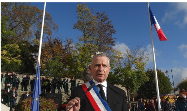
Hugues RIBAUT Maire d'Andrésy