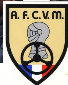
Association Française des Collectionneurs de Véhicules Militaires