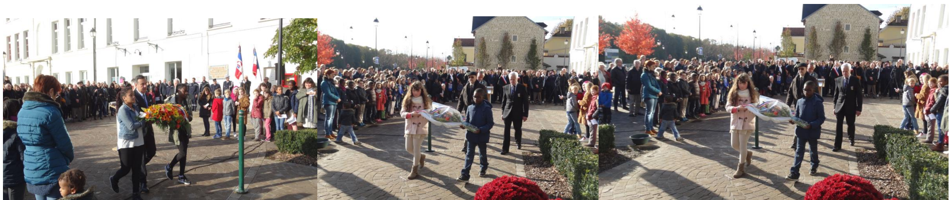
Dépôts de fleurs par les différents représentants de la commune, des associations et par les élèves des écoles